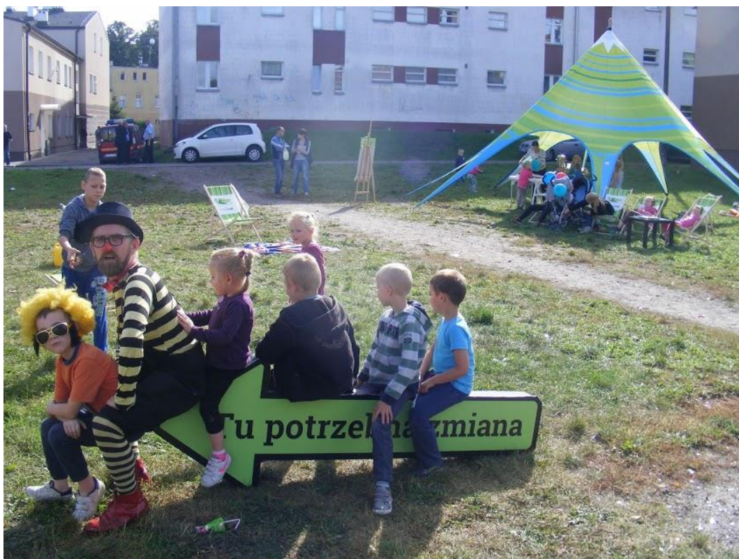
Lębork obszar rewitalizacji, Spotkanie pod namiotem