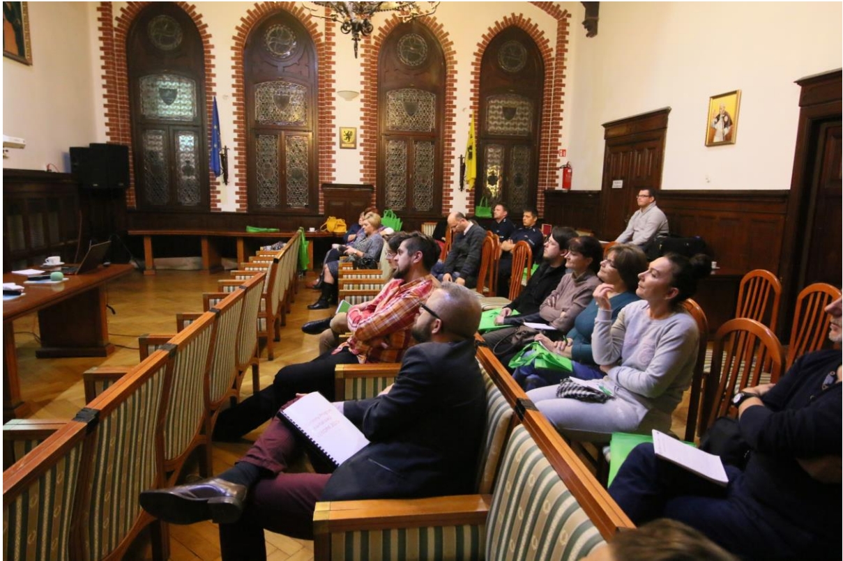
Spotkanie dla mieszkańców

W trakcie trwania konsultacji nie wpłynęła ani jedna uwaga do Gminnego Programu Rewitalizacji dla miasta Lęborka.