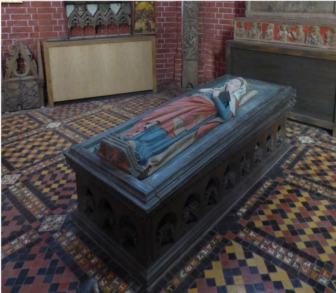
Bad Doberan / Germany