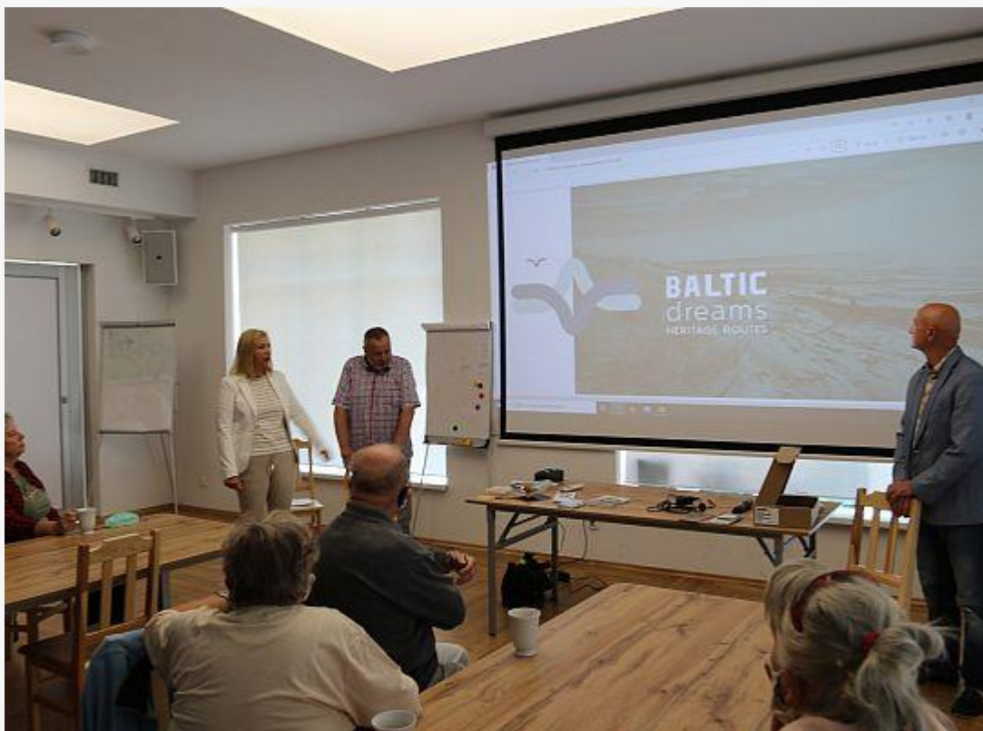
Seminar with seniors Łębork 10.07.2020