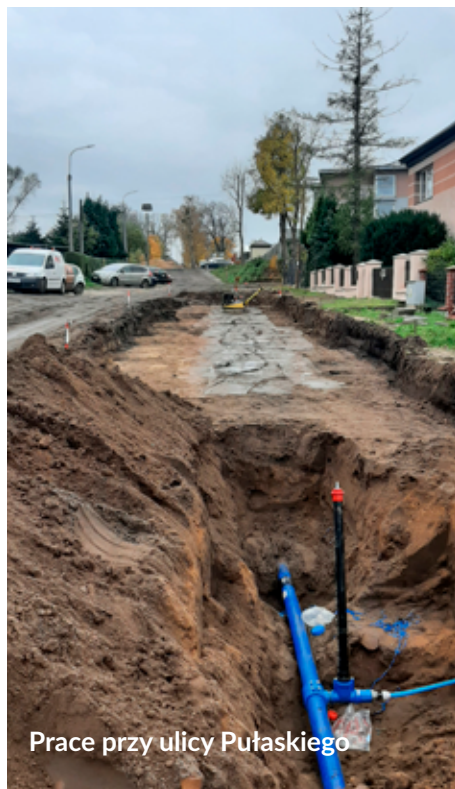
Prace przy ulicy Pułaskiego

W Oczyszczalni Ścieków zamontowany został nowy przepływomierz do pomiaru