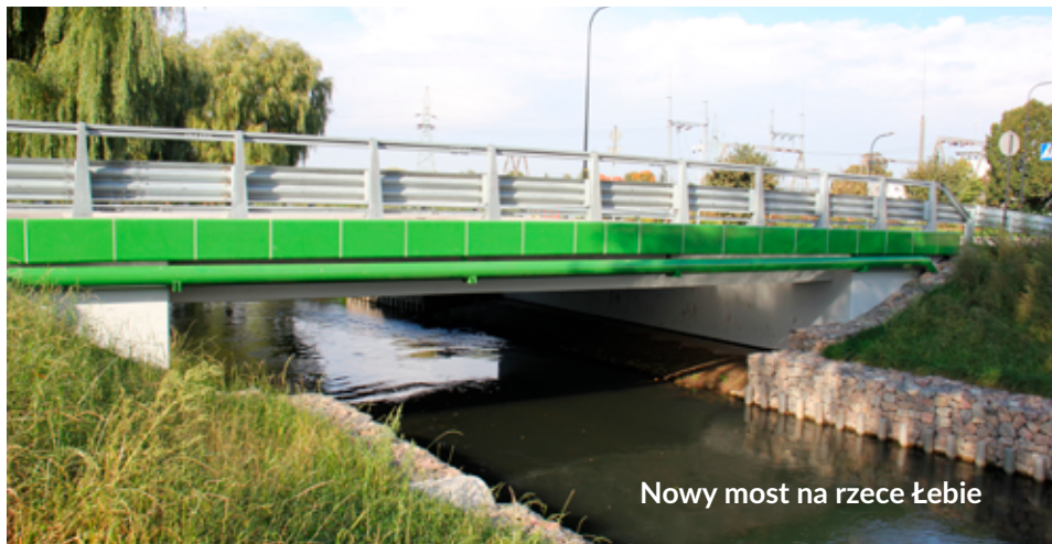
Nowy most na rzece Łębie

– To początek przyszłego połączenia ulicy Czołgistów przez Skarżyńskiego i Nadmorską z ulicą Kossaka. Zaczęliśmy tutaj, przy Czołgistów i Kazimierza Wielkiego oraz z drugiej strony, skrzyżowaniem Kossaka