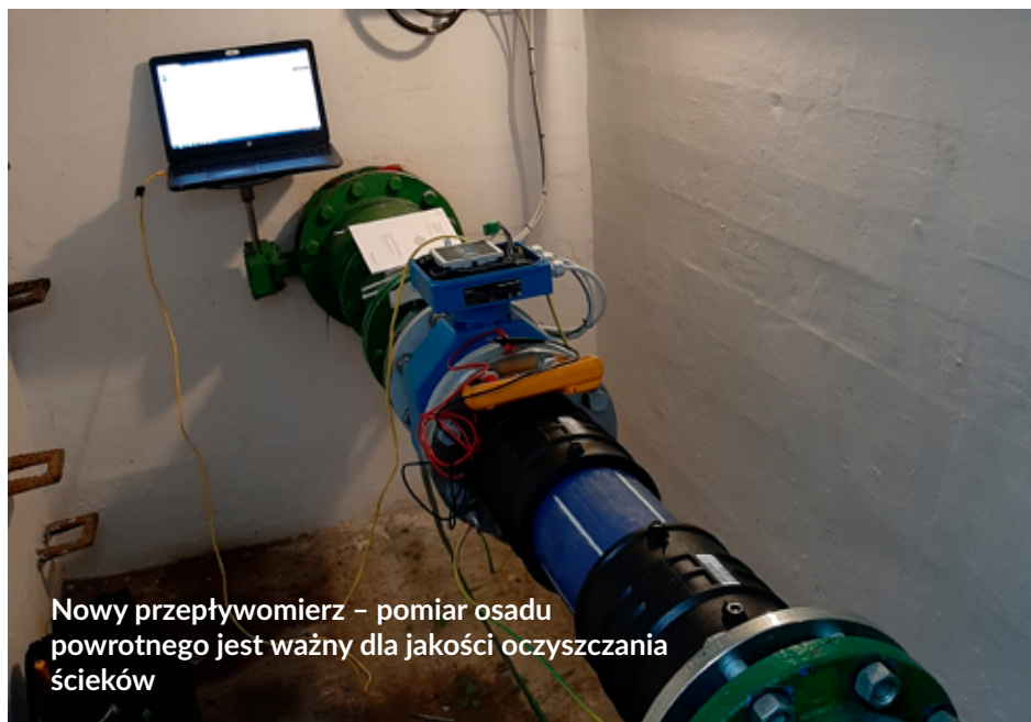
Nowy przepływomierz – pomiar osadu powrotnego jest ważny dla jakości oczyszczania ścieków

W przeciągu ostatnich lat zmienił się także profil obciążenia oczyszczalni. Prawidłowo dobrana i funkcjonująca bateria kondensatorów pozwala uniknąć naliczania dodatkowych opłat za energię bierną, co w przypadku łębarskiej oczyszczalni