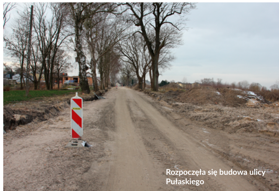
Rozpoczęła się budowa ulicy Pułaskiego

Drugie zadanie realizowane w tym rejonie pn. Budowa kluczowego elementu systemu odprowadzania wód opadowych z rejonu ul. Pułaskiego w Łęborku dofinansowane jest ze środków unijnych. Miasto Łębork pozyskało środki na ten