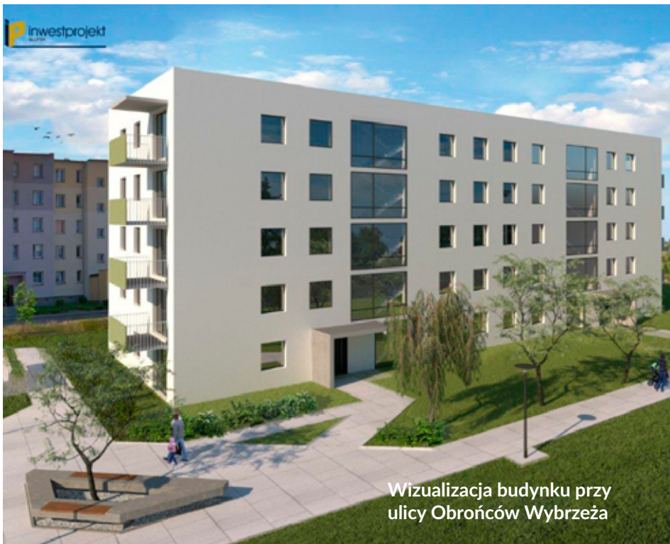
Wizualizacja budynku przy ulicy Obrońców Wybrzeża

Łęborskie Towarzystwo Budownictwa Społecznego Sp. z o.o. przystępuje do nowego programu skierowanego do mieszkańców. To oferta na pierwsze mieszkanie, m.in. dla młodych małżeństw lub osób chcących założyć rodzinę, część lokali przeznaczonych będzie również dla osób po 60 roku życia.