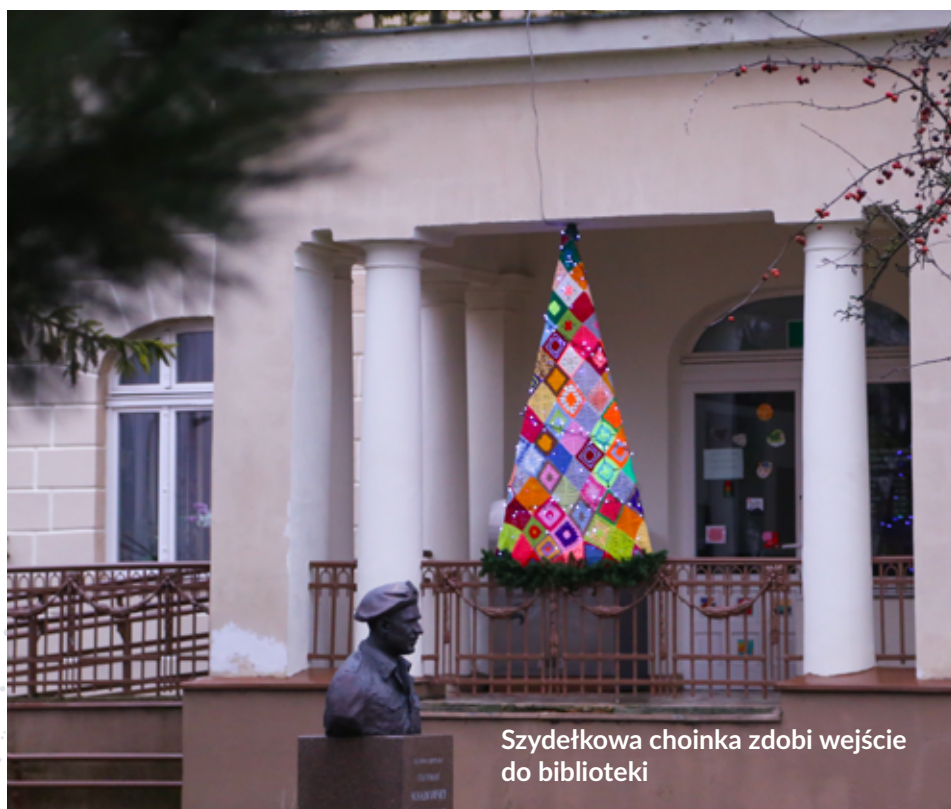
Szydełkowa choinka zdobi wejście do biblioteki

Biblioteka nie zapomniała również i w tym roku przygotować odświętne ubranka dla zabawek. Wystarczy wybrać się na spacer i podziwiać rękodzieło naszych lęborskich pasjonatek.