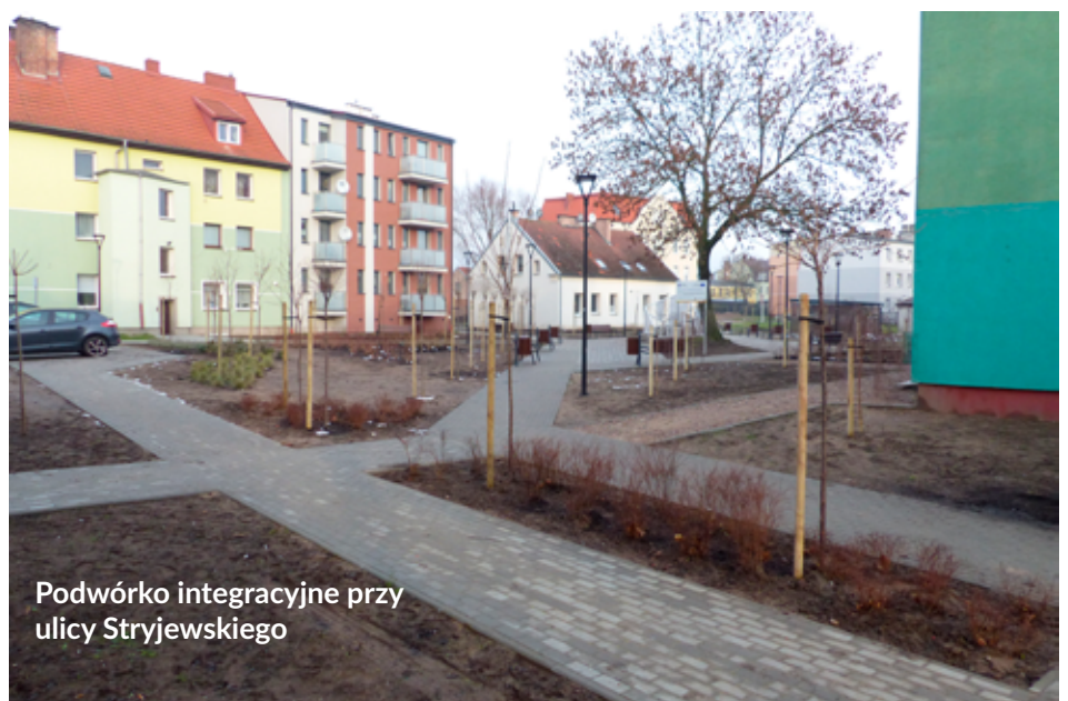
Podwórko integracyjne przy ulicy Stryjewskiego

Budowa podwórek integracyjnych jest realizowana w ramach dużego projektu inwestycyjno-infrastrukturalnego „Odnowiony Łębork - rewitalizacja obszaru Nowy Świat”. Jego łączna wartość to aż 20 mln 467 tys. zł, w tym 11 mln 423 tys. zł to pozyskana przez Miasto Łębork dotacja.