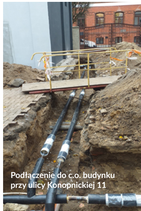
Podłączenie do c.o. budynku przy ulicy Konopnickiej 11

ul. Gdańskiej 96. Wykonano także sieć ciepłowniczą w rejonie ul. Różyckiego wraz z przyłączem do nowo powstałego budynku mieszkalnego przy Różyckiego 13.