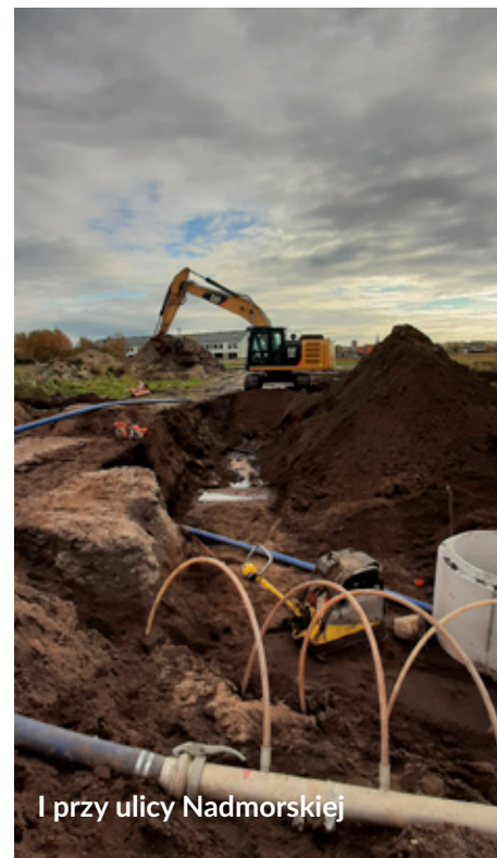
I przy ulicy Nadmorskiej