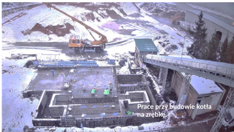
Prace przy budowie kotła na zrębke

Koszt zadania wyniósł 1.176.000 zł netto. Zadanie wykonywał GPEC Serwis Sp. z o.o. w Gdańsku.