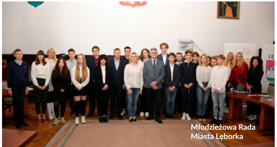
Młodzieżowa Rada Miasta Lęborka