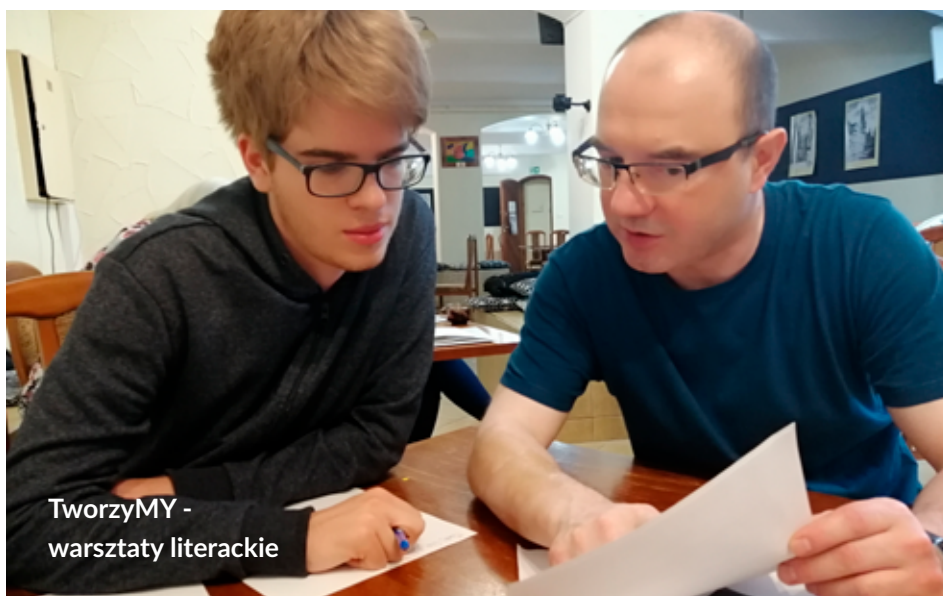
TworzyMY - warsztaty literackie