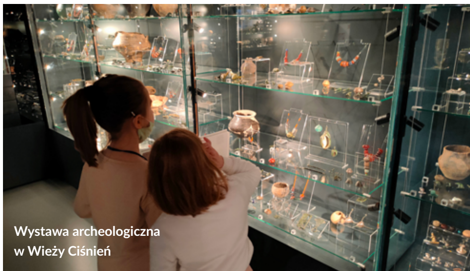
Wystawa archeologiczna w Wieży Ciśnień

Wystawa została otwarta w odremontowanym obiekcie Wieży Ciśnień. Na ekspozycji, poza naczyniami szklanymi, prezentowane są przedmioty związane z okresem wpływów rzymskich, okresem wędrówek ludów oraz wczesnym średniowieczem na Ziemi Łęborskiej.