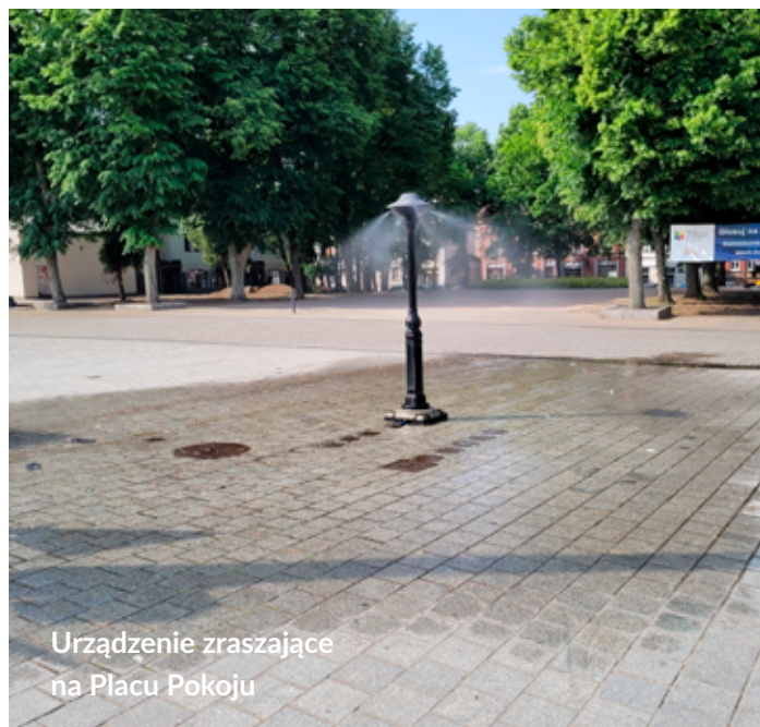
Urządzenie zraszające na Placu Pokoju

Podczas letnich upałów miłe orzeźwienie przynosi mieszkańcom i turystom urządzenie zraszające, zainstalowane kilka tygodni temu na Placu Pokoju przez MPWiK.