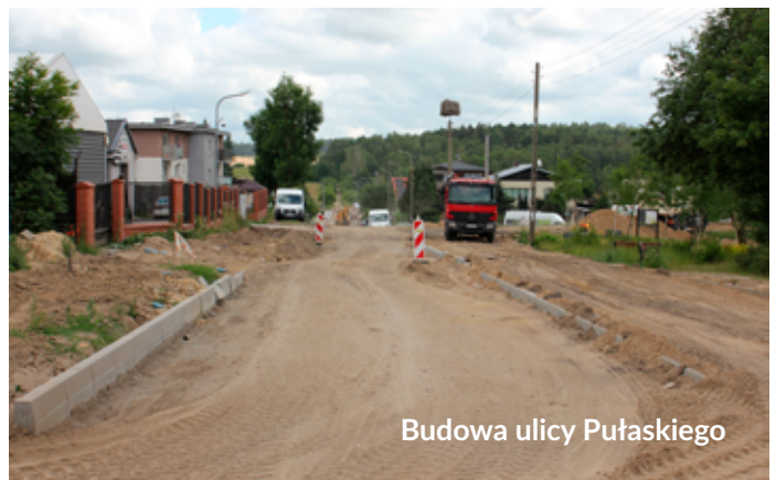
Budowa ulicy Pułaskiego

G runтова dotąd droga zmieni się nie do poznania. Roboty w tym obszarze obejmują dwa zadania inwestycyjne - wykonanie systemu odprowadzania wód opadowych z tego rejonu oraz budowę ulicy Pułaskiego na odcinku od ul. Gierzyńskiego do ul. Gajowej.