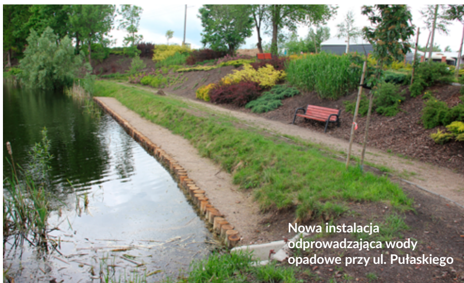
Nowa instalacja odprowadzająca wody opadowe przy ul. Pułaskiego

Rejon ulicy Pułaskiego charakteryzuje się dużymi różnicami wysokościowymi, co podczas ulewnych opadów powoduje problemy ze spływem i odprowadzaniem