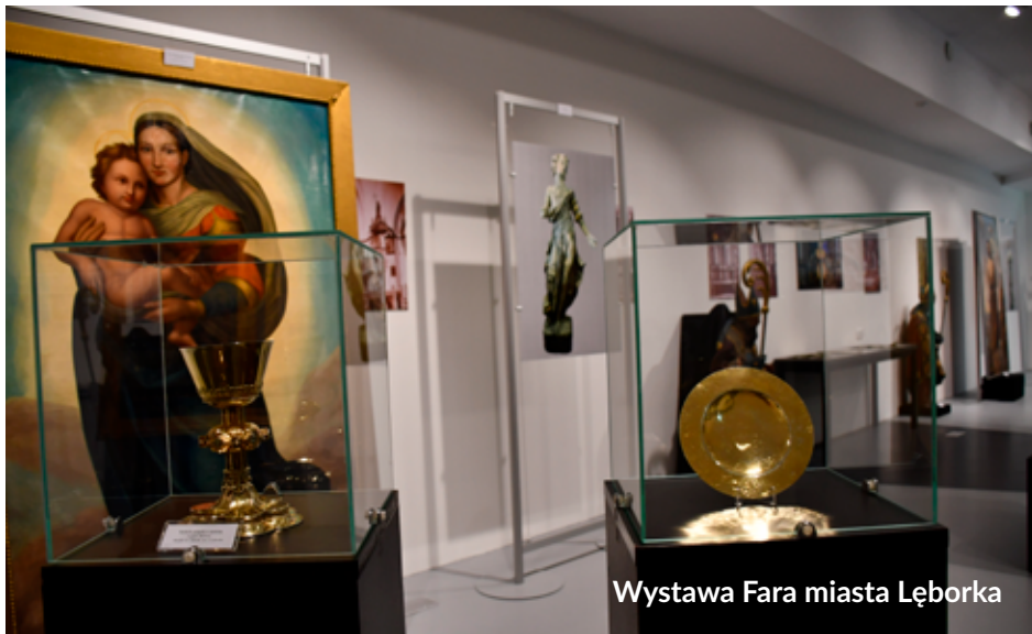
Wystawa Fara miasta Łęborka