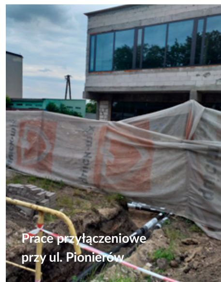
Prace przyłączeniowe przy ul. Pionierów

Wolności. Remont sieci na odcinku ok. 60 mb wyprzedza prace ziemne związane z budową parkingu przy skrzyżowaniu Al. Wolności i ul. Konopnickiej.