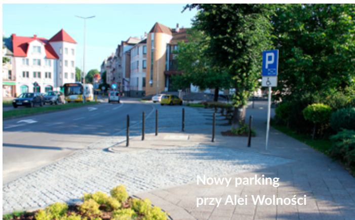
Nowy parking przy Alei Wolności

P rzy Alei Wolności, tuż przy ulicy Staromiejskiej, powstały nowe miejsca parkingowe. W miejscu niewielkiej zatoki postojowej na 4-5 aut powstał parking na 14 pojazdów, w tym 2 dla osób z niepełnosprawnościami.auta parkują teraz na ukos do ulicy.