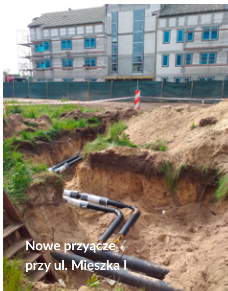
Nowe przyłącze przy ul. Mieszka I

Trwają też prace związane z remontem i modernizacją miejskiej sieci ciepłowniczej w rejonie ul. Konopnickiej i Al.