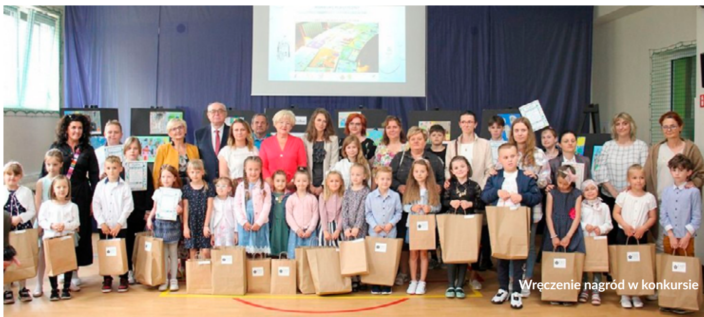
Wręczenie nagród w konkursie