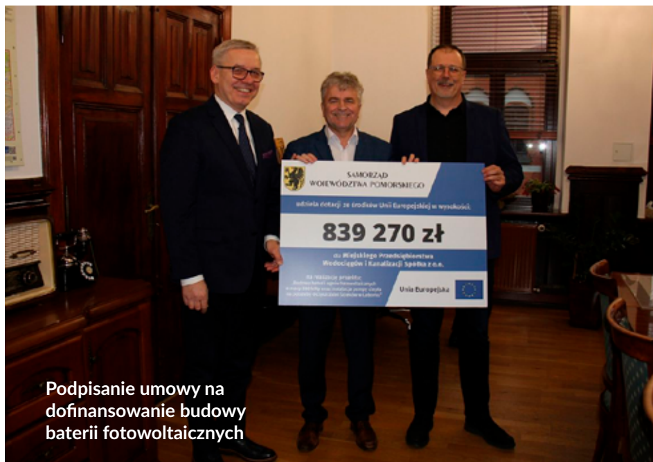
Podpisanie umowy na dofinansowanie budowy baterii fotowoltaicznych

Inwestycja przyczyni się do wzrostu bezpieczeństwa energetycznego oraz budowy systemu rozproszonej energetyki w regionie. Realizacja przedsięwzięcia poprawia efektywność energetyczną, w szczególności wnosi wkład w cel określony w Regionalnym Programie Operacyjnym Województwa Pomorskiego, jakim jest poprawa bezpieczeństwa energetycznego z wykorzystaniem zasobów energii odnawialnej. Nie bez znaczenia jest również kwestia ekologiczna. Efektem przedsięwzięcia będzie zmniejszenie emisji dwutlenku węgla do atmosfery, na poziomie 142 ton w ciągu roku.