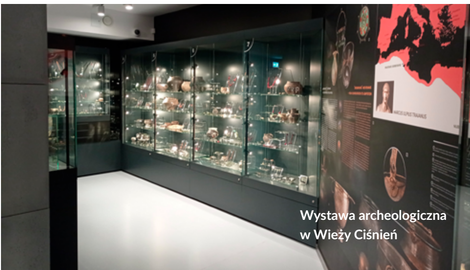
Wystawa archeologiczna w Wieży Ciśnień

Od wielu lat Muzeum w Łęborgku uczy bawiąc i bawi ucząc, poprzez prowadzenie zajęć, tzw. „Urodzinek w Muzeum”.