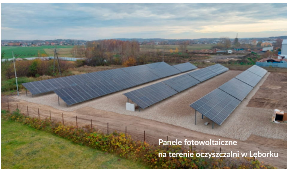
Panele fotowoltaiczne na terenie oczyszczalni w Łęborku

energii z promieni słonecznych. Montaż powietrznej pompy ciepła spowoduje wzrost komfortu cieplnego dla osób wykonujących prace w pomieszczeniu, zapewni właściwą temperaturę dla