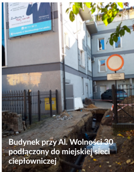
Budynek przy Al. Wolności 30 podłączony do miejskiej sieci ciepłowniczej

- W najbliższym czasie Spółka rozpocznie prace związane z budową sieci ciepłowniczej i przyłączy w rejonie ul. Obrońców Wybrzeża, gdzie wykonywane będą przyłącza do budynków przy ul. Olimpijczyków 3, 3a oraz Wojska Polskiego 11.