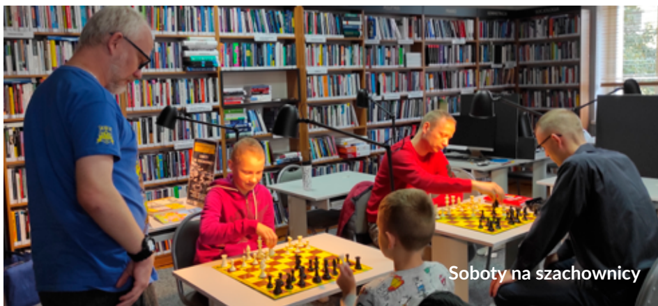
Soboty na szachownicy

Konkurs literacki „Szeptem”. Konkurs adresowany jest do młodzieży i gromadzi najbardziej utalentowanych literacko mieszkańców powiatu łębskiego. Wolny świąteczny okres można wykorzystać na pisanie i szlifowanie utworów (poezja i proza), bo już na początku stycznia na stronie internetowej biblioteki zostaną ogłoszone szczegółowe zasady konkursu.