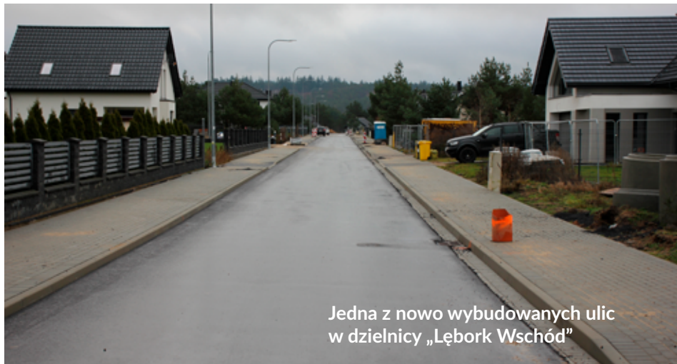
Jedna z nowo wybudowanych ulic w dzielnicy „Lębork Wschód”

Ulice Wrzosowa, Miodowa, Malinowa, Poziomkowa, Jagodowa, Jeżynowa, Miętowa, Lwowska, Grodzieńska i Graniczna (część) na osiedlu „Lębork Wschód” były