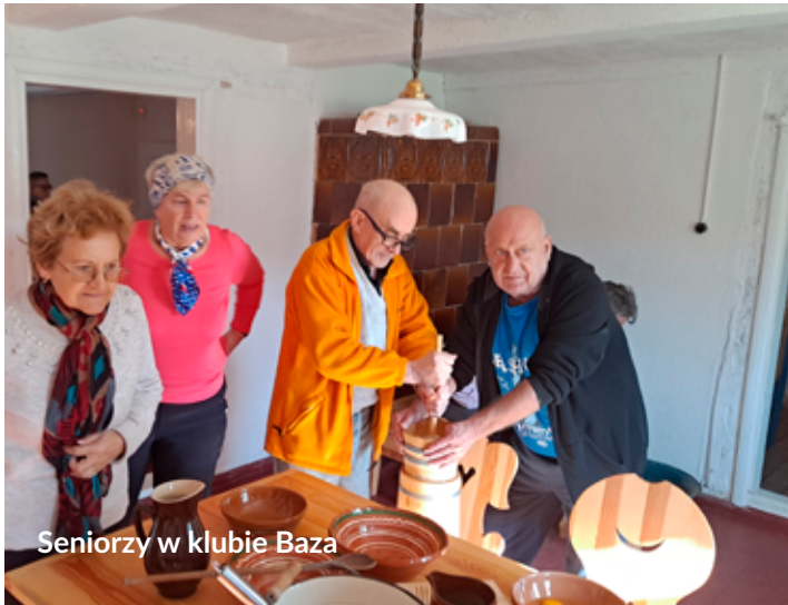
Seniorzy w klubie Baza

W Klubie Osiedlowym Baza organizowane są warsztaty dla Seniorów, które odbywają się od poniedziałku do piątku w godzinach 9.00-11.00.