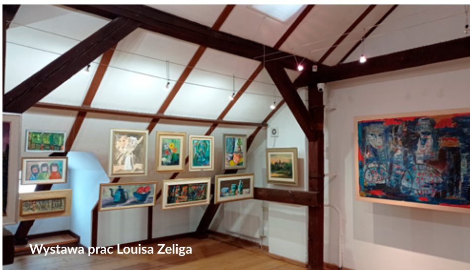
Wystawa prac Louisa Zeliga