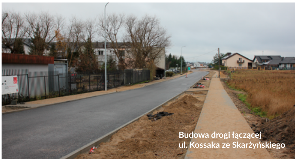
Budowa drogi łączącej ul. Kossaka ze Skarżyńskiego

Nowa droga jest niezbędna do obsługi wciąż budującego się osiedla mieszkaniowego w rejonie ulicy Nadmorskiej i stworzy nowe połączenie tej dzielnicy z miastem, poprzez skrzyżowanie z ulicami Stryjewskiego i Mostnika i alternatywnie dalej, przez nowy most na Czołgistów.