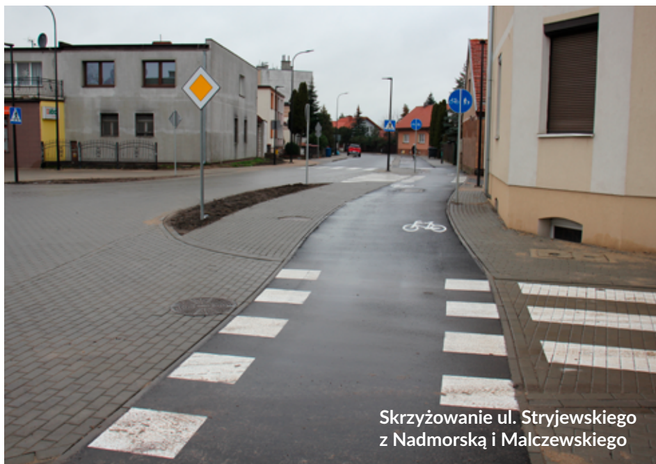
Skrzyżowanie ul. Stryjewskiego z Nadmorską i Malczewskiego

Jego łączna wartość to aż 20 mln 467 tys. zł, w tym 11 mln 423 tys. zł to pozyskana przez Miasto Lębork unijna dotacja.