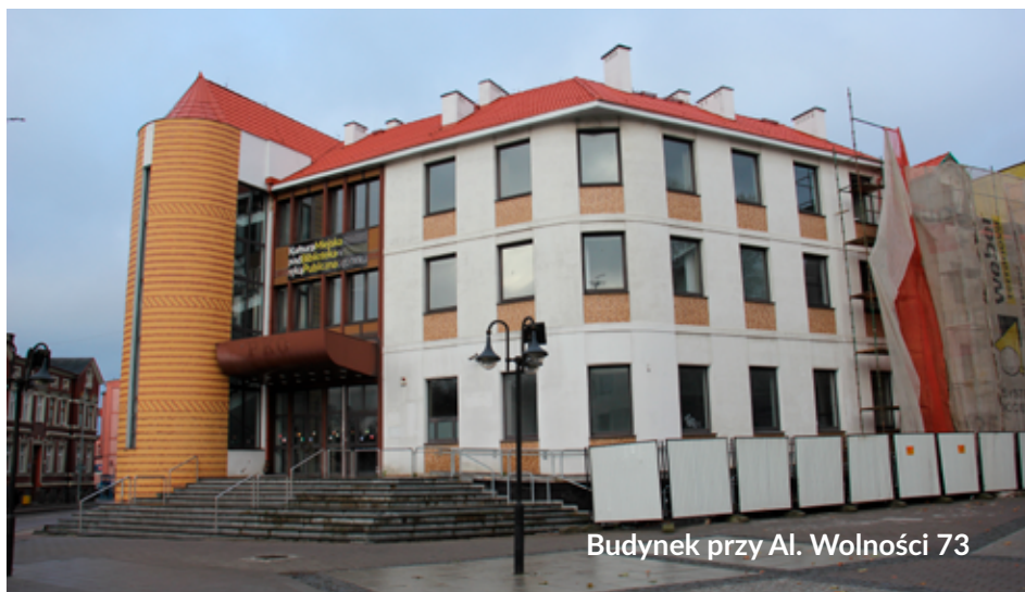
Budynek przy Al. Wolności 73

Przetarg na I etap modernizacji obiektu pn. „Bank Kultury – przebudowa dawnego banku na siedzibę Miejskiej Biblioteki Publicznej w Lęborku” wygrała firma UTENA Marek Lewnau z Gniewina. Koszt I etapu prac wyniesie 8 mln 850 tys. złotych. Inwestycja uzyskała dofinansowanie Rządowego Funduszu Polski Ład: Program Inwestycji Strategicznych w wysokości 6 mln 910 tys. 80 zł, tj. 78,07% wartości kosztów I etapu.