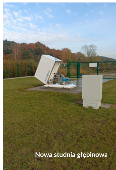
Nowa studnia głębinowa

Nowa studnia pozwoli zabezpieczyć rosnące potrzeby mieszkańców i obronić się przed deficytem wody powodowanym przez suszę hydrologiczną, która w miesiącach letnich jest coraz bardziej odczuwalna.