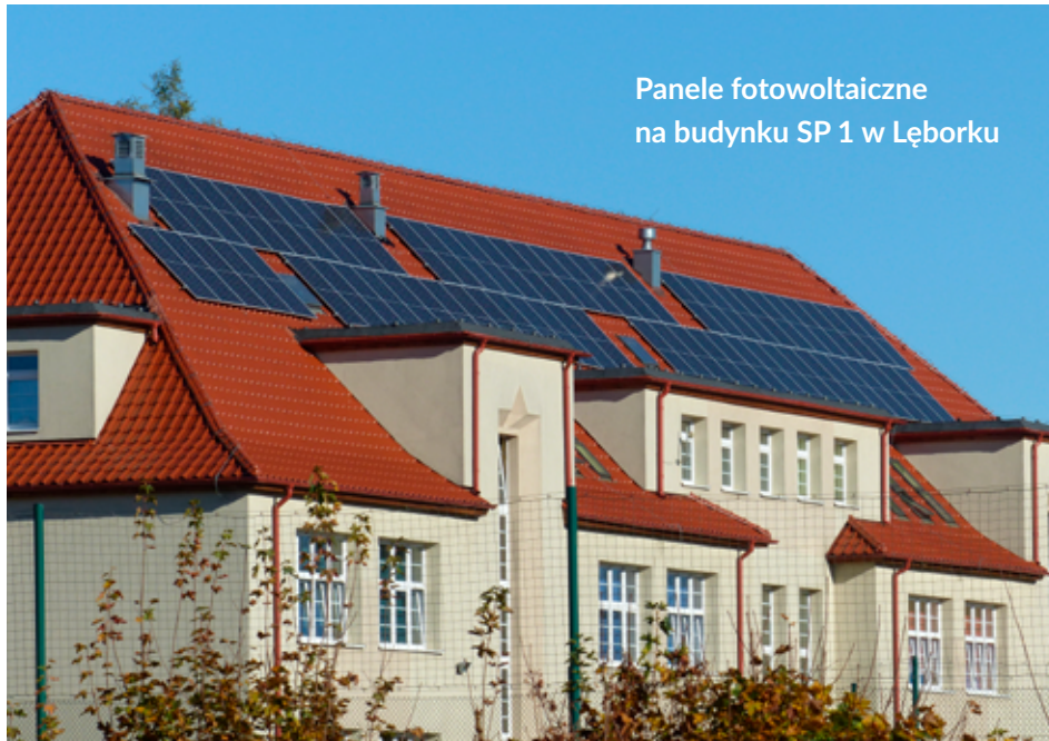
Panele fotowoltaiczne na budynku SP 1 w Lęborku

W placówkach, na których panele fotowoltaiczne będą zamontowane do 31 grudnia br., zostaną one podłączone do sytemu energetycznego już w styczniu 2023 roku. Projekt zakończony ma być do 30 kwietnia 2023 roku.