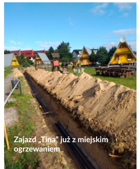
Zajazd „Tina” już z miejskim ogrzewaniem