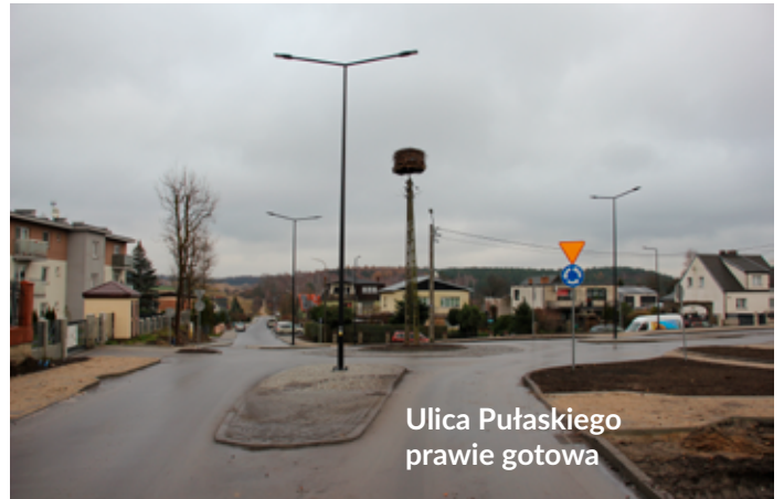
Ulica Pułaskiego prawie gotowa

Koszt inwestycji to 3,5 mln złotych, z czego połowa do dotacja pozyskana z Rządowego Funduszu Rozwoju Dróg. Wykonawcą zadania jest Przedsiębiorstwo Budowlane „WÓJCIK” z Lęborka.