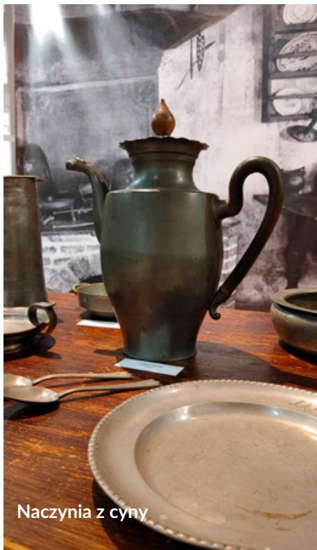
Naczynia z cyny

Ekspozycja dostępna jest w godzinach pracy muzeum, tj. od wtorku do piątku w godz.10.00-16.00, w weekendy w godz. 11.00-16.00.