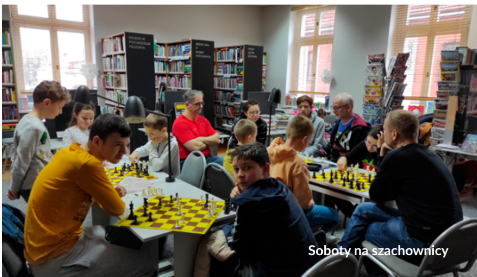
Soboty na szachownicy