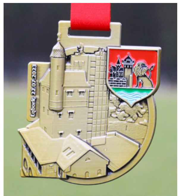
Medal za Bieg Uliczny Św. Jakuba 2023

Jest również możliwość zapisania się osobiście w dniu biegu w Biurze Zawodów, mieszczącym się w sali gimnastycznej Specjalnego Ośrodka Szkolno - Wychowawczego w Lęborku przy ul. Curie-Skłodowskiej w godz. 11.00 – 15.00. Więcej szczegółów i regulamin zawodów znajduje się na stronie internetowej www.csir.lebork.pl