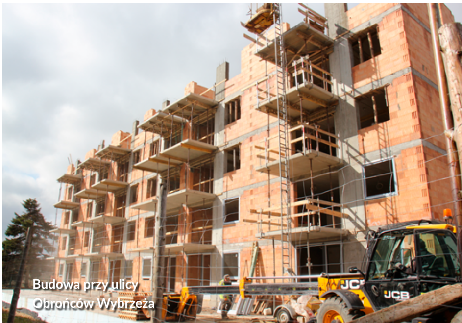
Budowa przy ulicy Obrońców Wybrzeża

W ramach Społecznej Inicjatywy Mieszkaniowej planowany jest też budynek przy ul. Stryjewskiego 12 (16 mieszkań z windą).