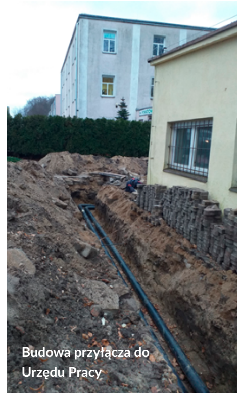
Budowa przyłącza do Urzędu Pracy

bezpieczeństwo funkcjonowania urządzeń technicznych, kocioł zostanie ostatecznie przejęty w eksploatację przez MPEC Sp. z o.o.