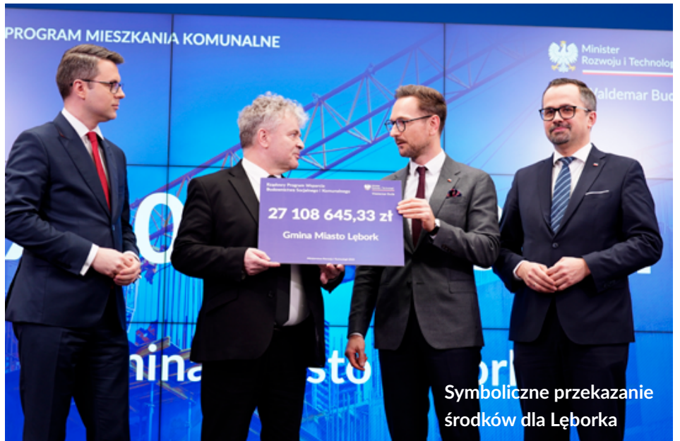
Symboliczne przekazanie środków dla Lęborka

Miasto otrzymało na ten cel z Funduszu Dopłat aż 18 mln 909 tys. zł.