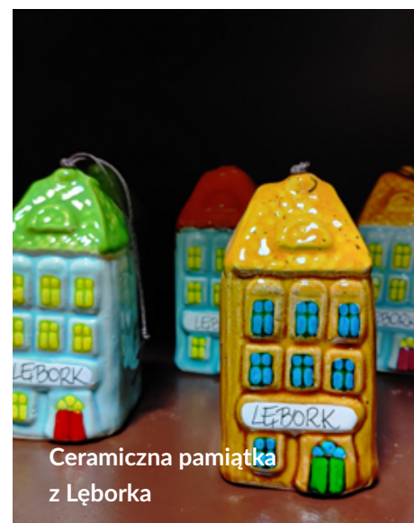
Ceramiczna pamiątka z Łęborka

Muzealna „Cepelia” jest czynna od wtorku do piątku w godzinach 10.00 – 15.30 oraz w sobotę i niedzielę w godzinach 11.00 – 15.30.