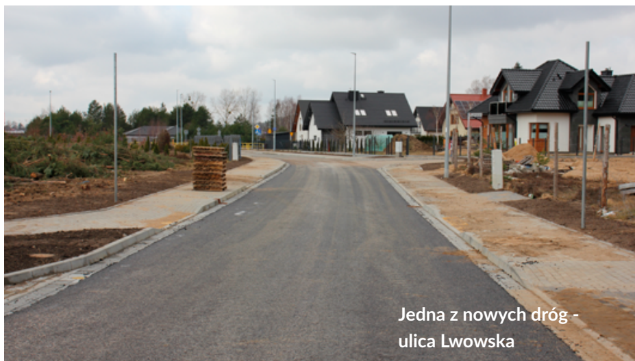
Jedna z nowych dróg - ulica Lwowska

Miasto Lębork na tę dużą inwestycję drogową pozyskało 8 mln 820 tys. 126 zł dofinansowania z Rządowego Funduszu Polski Ład – Program Inwestycji