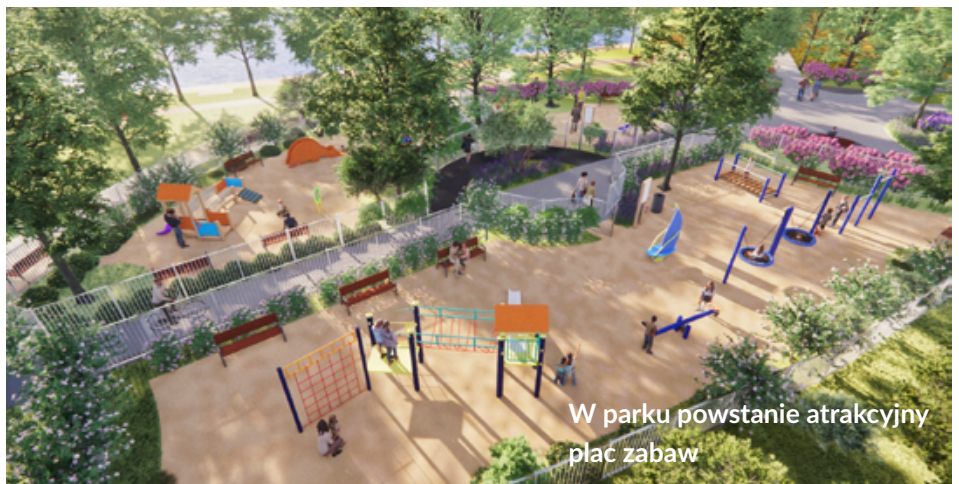
W parku powstanie atrakcyjny plac zabaw

Zakres robót w Parku im. Marii i Lecha Kaczyńskich obejmuje kompleksową