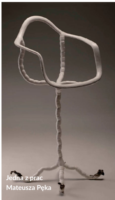
Jedna z prac Mateusza Pęka