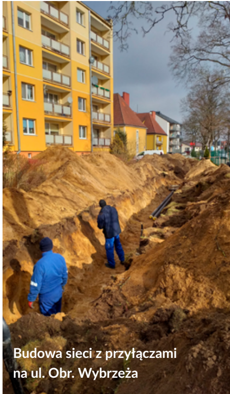
Budowa sieci z przyłączami na ul. Obr. Wybrzeża

Dobiegła końca budowa kotła na zrębek drzewną o mocy 5,1 MW. Wykonany został rozruch próbny kotła, a po uzyskaniu dokumentów z Urzędu Dostaw Technicznych potwierdzających