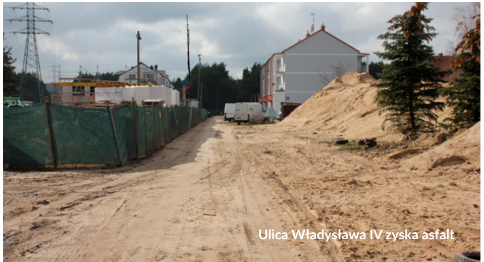
Ulica Władysława IV zyska asfalt

miała długość 470 m, asfaltową nawierzchnię o szerokości 5,5 metra oraz szerokie na 2 metry chodniki. Zaplanowano też budowę systemu kanalizacji deszczowej, zjazdów z drogi oraz 64 miejsc parkingowych.