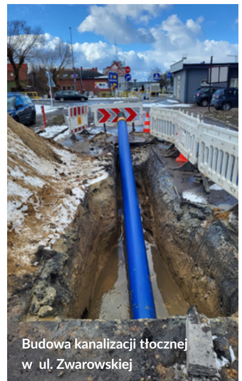
Budowa kanalizacji tłocznej w ul. Zwarowskiej