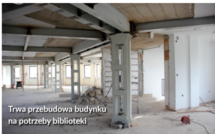
Trwa przebudowa budynku na potrzeby biblioteki

Z godnie z planem prowadzona jest przebudowa budynku dawnego banku PKO BP u zbiegu Alei Wolności ze Staromiejską na potrzeby miejskiej biblioteki.